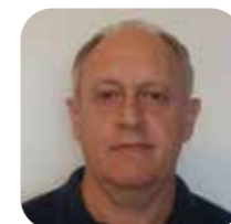
NERI Zanchetin Comarca de Canoas